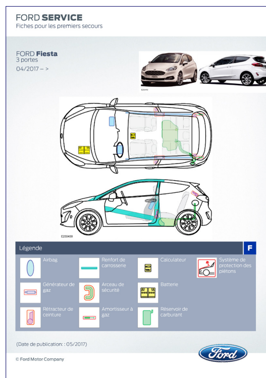
Exemple d'un « Rescue Sheet »