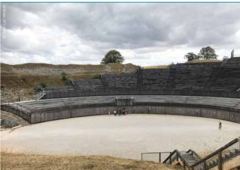
Amphitheater von Grand.

Touristen sind hier herzlich willkommen. Sogar die Schilder, die zum Befahren der Nationalstraße L132 einladen, sind in mehrere Sprachen übersetzt. Warum wir die Viezstraße ausgewählt haben? Wir wollen Ihnen Produkte der Region vorstellen, den Vogelschutz näherbringen und einen nachhaltigen Tourismus ermöglichen, der Obstgärten erhält und der Bevölkerung zusätzliche Einkommensquellen eröffnet. Unsere Route führt Sie zunächst nach Freudenburg. Danach geht es wieder zurück an die Saar, die sich einige Kilometer bis Saarlöcher durch die Landschaft schlängelt. In Losheim am See können Sie dann einen Imbiss genießen, bevor Sie Richtung Sankt Wendel weiterfahren. Die Umgebung dieser herrlichen Ortschaft lädt zu kurzen Abstechern ein: zum Beispiel an den Bostalsee, in die Region Schaumberg oder zur Benediktinerabtei Tholey. Das 634 gegründete Bauwerk ist das älteste Kloster Deutschlands. Vor Ihnen liegen jetzt noch 75 Kilometer sehr kurvenreicher Straßen – genau nach unserem Geschmack. Anschließend überqueren Sie in der Nähe des Flugplatzes Zweibrücken die französische Grenze.